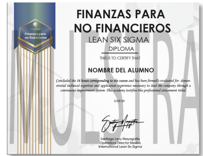
Ejemplo de diploma