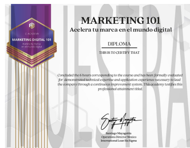
Ejemplo de Diploma